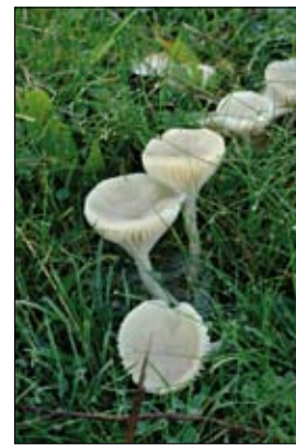
Sneeuwzwammetje, een wasplaat.

Een relatief eenvoudige ingreep als het in stand houden van een graanakker levert meteen al resultaat op. En zoals het vaker gebeurt met natuurbehoudsmaatregelen voor één soort, profiteren ook andere soorten hiervan. Zo oefent de grote hoeveelheid muizen die een dergelijke akker kan herbergen een grote aantrekkingskracht uit op de pleisterende torenvalk. De akkeronkruiden zoals wilde peen lokten dan weer heel wat insecten waaronder een groot aantal koninginpages.